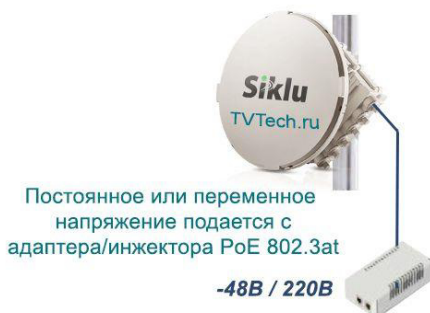
Схема подключения РРЛ оборудования Siklu серии EH2500FX с питанием через инжектор PoE встроенный в сетевое оборудование