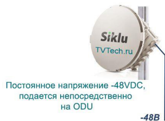
Схема подключения РПЛ оборудования Siklu серии EH2500FX с удаленным питанием по сети с постоянным током -48VDC

РПЛ оборудование компании Siklu серии EH-2500FX предусматривает возможность подключения к различным источникам электропитания (220В, -48В, PoE 802.3at) на любом объекте (на узле связи, на клиентской стороне, на базовой станции и т.д.).