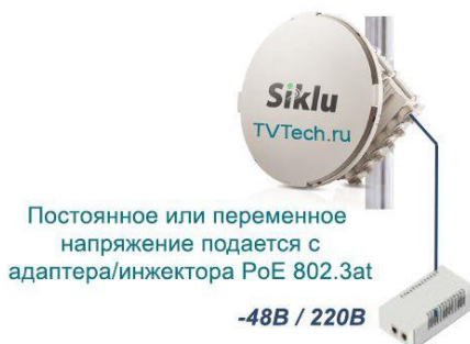
Схема подключения РРЛ оборудования Siklu серии EH2500F с питанием через инжектор PoE встроенный в сетевое оборудование