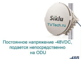
Схема подключения РПЛ оборудования Siklu серии EH2200FX с удаленным питанием по сети с постоянным током -48VDC

РПЛ оборудование компании Siklu серии EH-2200FX предусматривает возможность подключения к различным источникам электропитания (220В, -48В, PoE 802.3at) на любом объекте (на узле связи, на клиентской стороне, на базовой станции и т.д.).