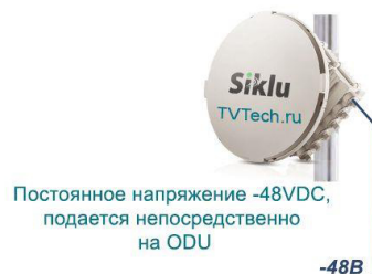
Схема подключения РРЛ оборудования Siklu серии EH1200FX с удаленным питанием по сети с постоянным током -48VDC

РРЛ оборудование компании Siklu серии EH-1200FX предусматривает возможность подключения к различным источникам электропитания (220В, -48В, PoE 802.3at) на любом объекте (на узле связи, на клиентской стороне, на базовой станции и т.д.).