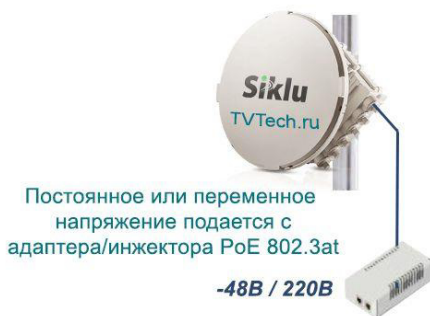
Схема подключения РРЛ оборудования Siklu серии EH1200FX с питанием через инжектор PoE встроенный в сетевое оборудование